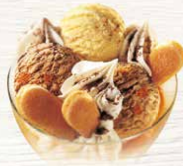
Coupe Wintertraum Cremiges Tiramisù-, Vanille-, und Chocolat Glace CHF 10.30 MEINE COUPE CHF 8.50