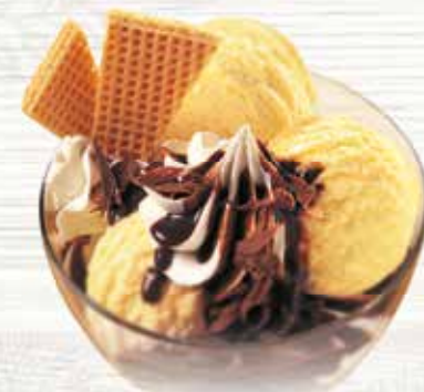
Coupe Danemark Feines Vanille Glace mit Chocosauce und Rahm CHF 9.80 MEINE COUPE CHF 8.00