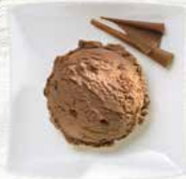
Chocolat Rahmglace mit Schokoladenstückchen