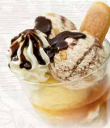
Coupe Amaretto Eine feine Kombination aus Tiramisù und Vanille Glace mit Amaretto CHF 10.30 MEINE COUPE CHF 8.50