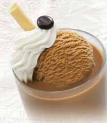
Ice Café CHF 9.00 MEINE COUPE CHF 7.50