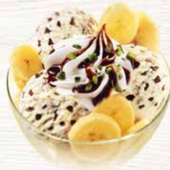
Stracciatella-Split Eine süsse Verführung aus Stracciatella,- Chocolat Rahmglace mit Banane und Chocosauce CHF 10.30 MEINE COUPE CHF 8.50