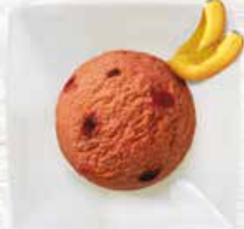
Sorbet Zwetschge Sorbet mit Zwetschgenstückchen