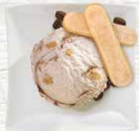
Tiramisù Glace mit Kaffeesauce und Gebäckstückchen