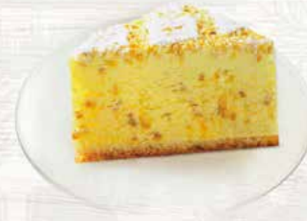
Nougat Glacetorte Köstliche Nougat Glacetorte mit caramelierten Nussstückchen CHF 6.00