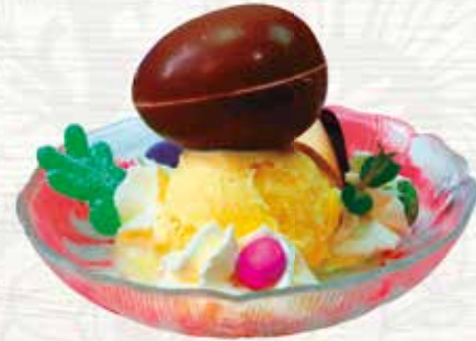
Kinderüberraschung Kugel Vanille Rahmglace mit Überraschung CHF 5.50