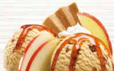
Coupe Apfel-Zimt Zimt-, Vanille Rahmglace mit Apfelschnitzen & Caramelsauce CHF 9.80 MEINE COUPE CHF 8.00