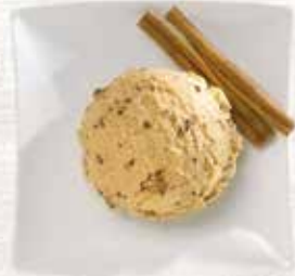
Zimt Rahmglace mit Zimtzuckerstückchen