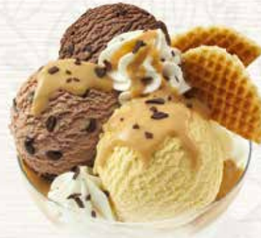
Coupe Säntis Feines aus den Glacevarianten Vanille, Chocolat und Café abgerundet mit Appenzeller Rahmlikör CHF 10.30 MEINE COUPE CHF 8.50