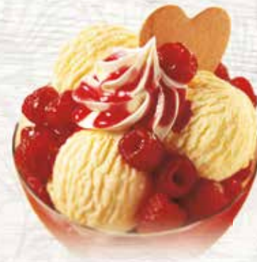
Coupe Winzenberg Feines Vanille Glace übergossen mit heissen Himbeeren, Meringues und mit Rahm vollendet CHF 9.80 MEINE COUPE CHF 8.00