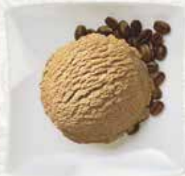
Ice Café Rahmglace