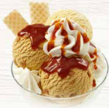
Coupe Alexandra Köstliches Vanille-, mit cremiger Caramel Rahmglace, Caramelsauce und Birnenstückchen CHF 9.80 MEINE COUPE CHF 8.00