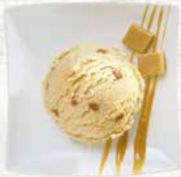
Caramel Rahmglace mit Caramelstückchen