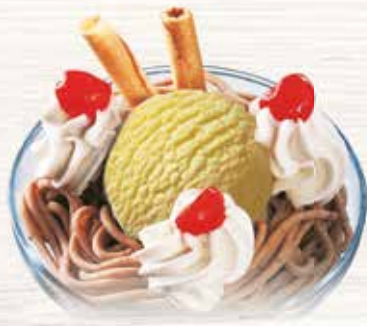
Coupe Nesselrode Feines Vanille Glace mit Vermicelles CHF 9.80 MEINE COUPE CHF 8.00