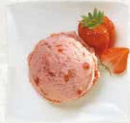
Erdbeer Rahmglace mit Erdbeerstückchen