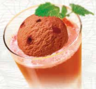
Sorbet Zwetschge mit Prune Fruchtiges Zwetschgen Sorbet mit Vielle Prune CHF 9.80 MEINE COUPE CHF 8.00